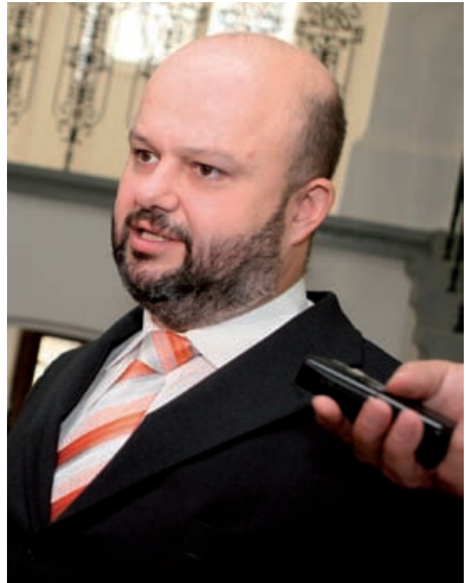
Martin Pecina předseda Úřadu pro ochranu hospodářské soutěže

Pro zřetelnější stratifikaci deliktů a jejich závažnosti vypracoval Úřad pro ochranu hospodářské soutěže metodický materiál věnovaný právě této problematice. Věřím, že tento dokument, který zpracovali přední odborníci ÚOHS, přispěje nejen k větší osvětě, ale rovněž i k další kultivaci soutěžního prostředí v České republice.