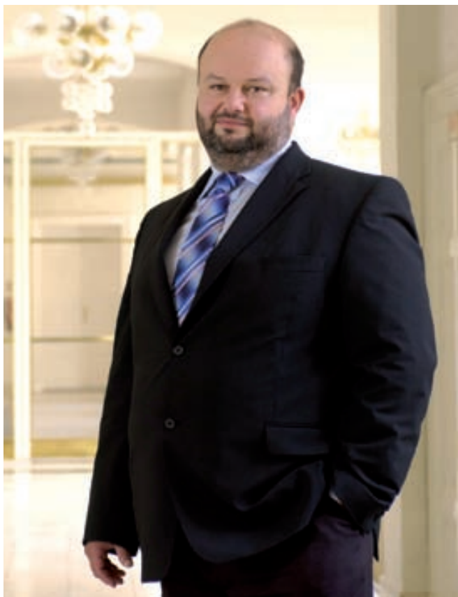
Martin Pecina předseda Úřadu pro ochranu hospodářské soutěže

Předsednictví České republiky v Radě Evropské unie je bezpochyby velmi významným okamžikem v dějinách našeho samostaného státu. Úřad pro ochranu hospodářské soutěže a jeho předseda nesdílí názory některých politiků, že jde o věc marginální, nedůležitou či pouze administrativní. Náš Úřad se proto bude snažit v maximální míře přispět k tomu, aby Česká republika v tomto testu dospělosti mezi evropskými národy co nejlépe obstála.