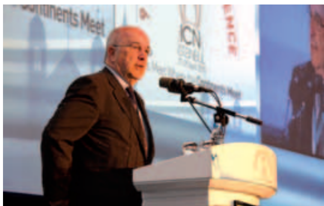
Joaquín Almunia, komisař EK pro hospodářskou soutěž

Závěry této konference pořádané tureckým antimonopolním úřadem vyzvedly významné úspěchy Mezinárodní sítě pro hospodářskou soutěž a ocenily také aktivní zapojení členů