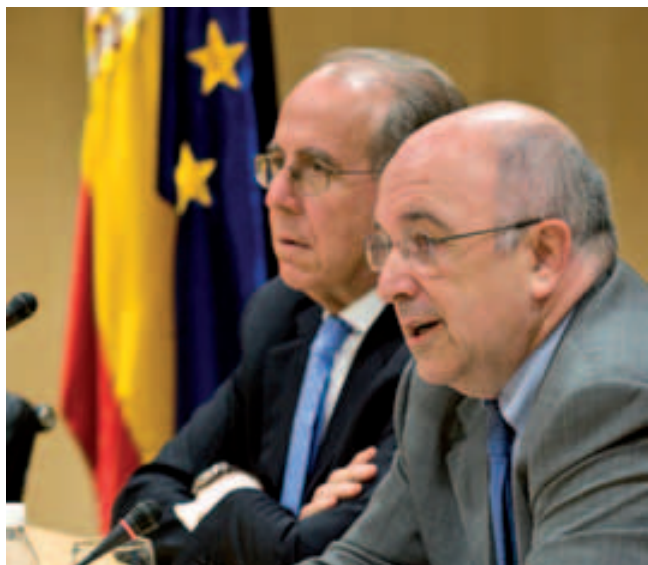
Zleva: Luis Berenguer, Joaquín Almunia

Ze závěrů konference vyplývá, že politika hospodářské soutěže Evropské komise se i nadále soustředí na přísné postihování kartelů, podporu sociální koheze, ochranu životního prostředí, strukturální změny v energetice, podporu rozvoje vysokorychlostních digitálních sítí a dostupnost finančních služeb pro širokou veřejnost. Kulatý stůl se zabýval tématem jak odradit soutěžitele od protisoutěžního chování, také významem výše pokut a poukázal na nutnost konvergence přístupu jednotlivých členských států ve snaze o sjednocení sankční politiky.