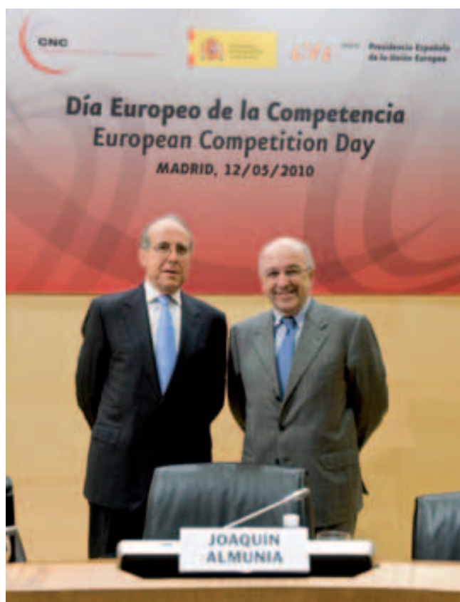
Luis Berenguer, předseda španělského soutěžního úřadu Comisión Nacional de la Competencia (CNC) a Joaquín Almunia, komisař EK pro hospodářskou soutěž

Cílem mezinárodní konference bylo zvýšit povědomí soutěžitelů o výhodách a hodnotách volné hospodářské soutěže. Španělsko se v rámci svého předsednictví zaměřilo na řešení dopadů finanční a hospodářské krize, revitalizaci jednotného evropského trhu, fungující hospodářskou soutěž jako jeden z nejdůležitějších nástrojů posílení trhu a na odstranění negativních dopadů opatření jednotlivých národních vlád přijatých v rámci řešení ekonomické a finanční krize. Více než nesystémová opatření, která měla krátkodobě pomoci národním ekonomikám nebo vybraným sektorům, se v dlouhodobém tržním vývoji osvědčují systémová řešení vedoucí k liberalizaci a odstranění protisoutěžních bariér.