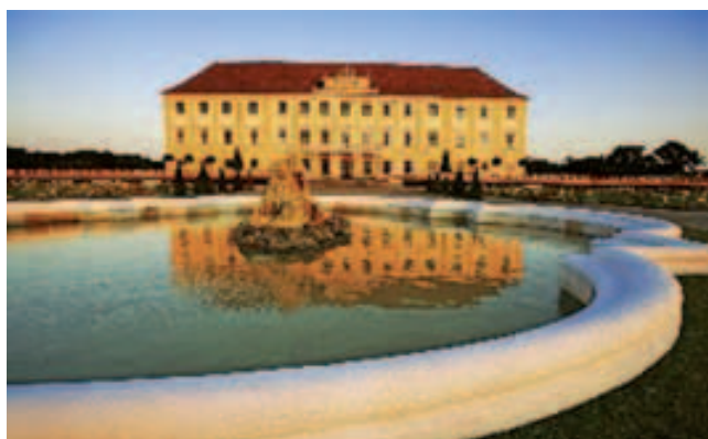
Zámek Marchfeld

www.bwb.gv.at/BWB/Marchfeld+Competition+Forum/default.htm