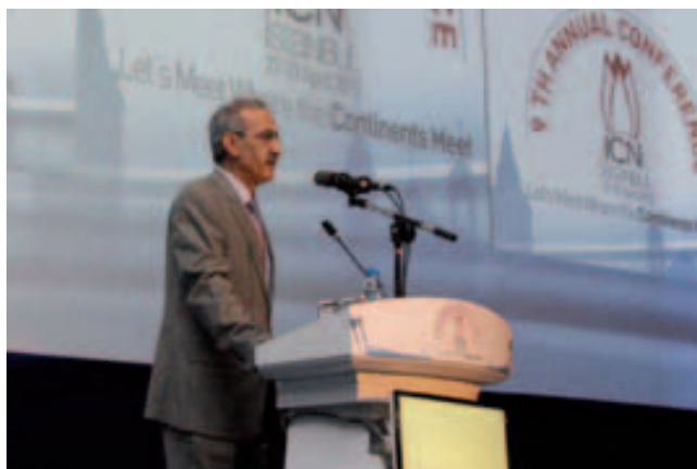
Nurettin Kaldirimci, prezident Tureckého soutěžního úřadu (Rekabet Kurumu – RK)

do činnosti fóra. Neformální pracovní metody a snaha o vytvoření shodného přístupu na základě otevřeného multilaterálního dialogu efektivně ovlivnily práci i výsledky soutěžních úřadů. Výsledky činnosti ICN využívají zkušené i nové soutěžní úřady a doporučení ICN v řadě případů vedla k legislativní změně v právních rádech členských zemí. Stále častěji se ICN zaměřuje na implementaci, na zajištění účinných a prospěšných dopadů své činnosti s cílem co nejlépe dosáhnout efektivnějšího prosazování pravidel hospodářské soutěže prostřednictvím užší spolupráce a sdílení osvědčených postupů.