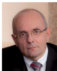
Kamil Jankovský ministr pro místní rozvoj

Absolvent Hornicko-geologické fakulty na Vysoké škole báňské v Ostravě. Po několikaletém působení v soukromém sektoru se stal místostarostou Frýdku-Místku a později byl zvolen do Poslanecké sněmovny Parlamentu České republiky, kde působil v rozpočtovém výboru a byl rovněž předkladatelem zákona o zneužití významné tržní síly. Od 9. července 2009 je předsedou Úřadu pro ochranu hospodářské soutěže.