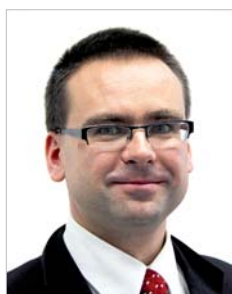
Michal Petr místopředseda Úřadu pro ochranu hospodářské soutěže

Pokud jde o soudy, jejich rozhodování není dost dobře možné plánovat, blíží se však rozhodnutí v řadě velmi významných kauz, která mohou činnost Úřadu v příštím roce významně poznamenat.