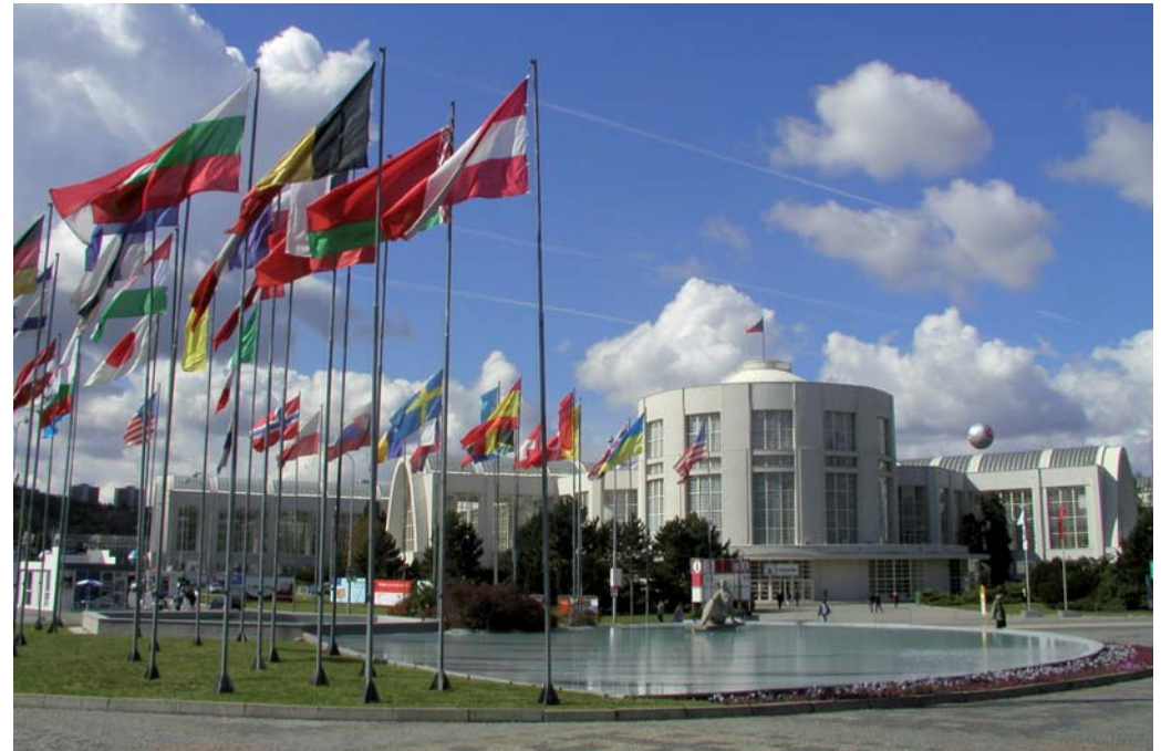
Brněnské výstaviště / Brno Exhibition Centre