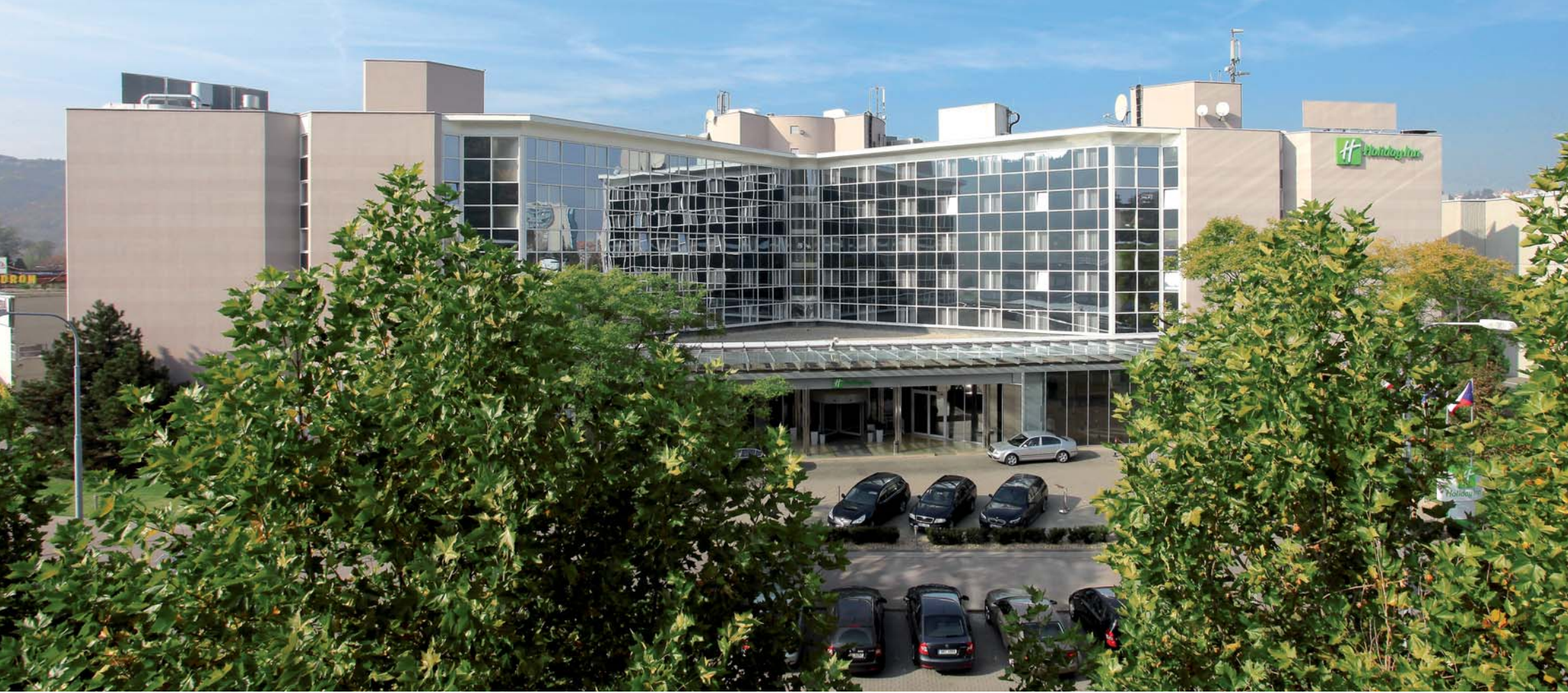
Holiday Inn