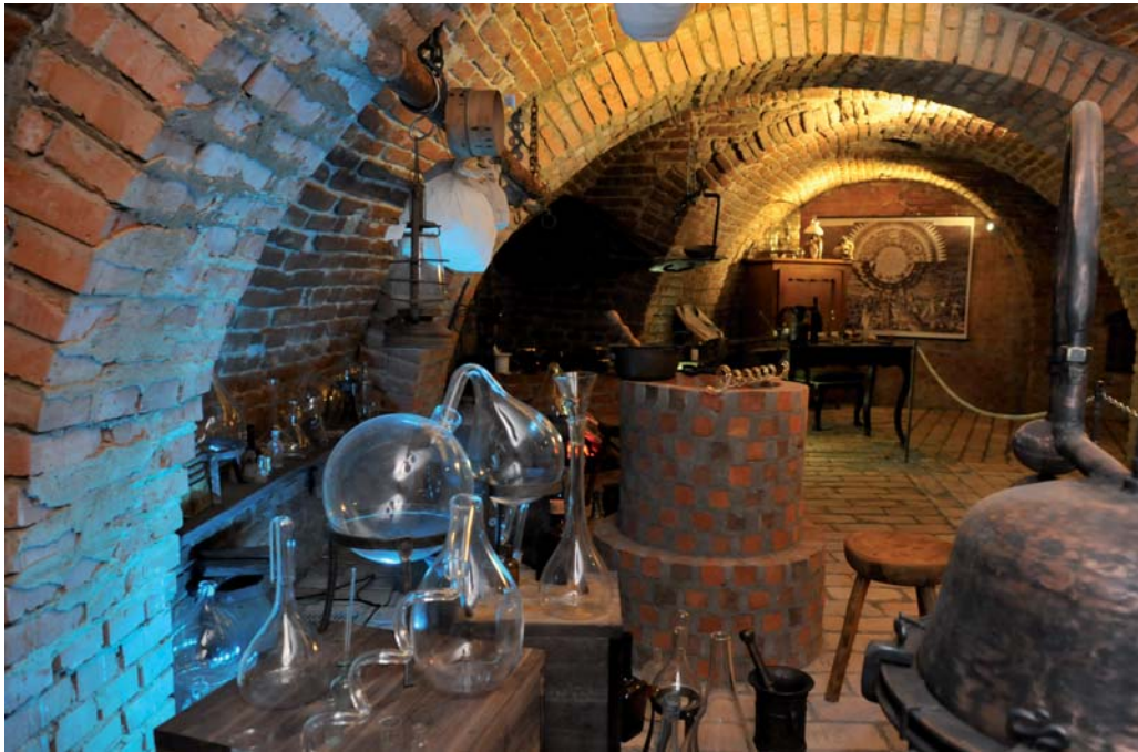
Labyrint – podzemí pod Zelným trhem / Labyrinth under Zelný Trh Square ( Zdeněk Kolařík )