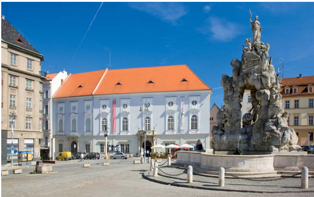
Zelný trh / Zelný Trh Square ( Vít Mádr )