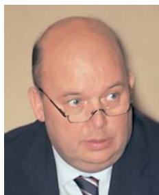
Miroslav Toman prezident Potravinářské komory České republiky

Vystudoval Právnickou fakultu Masarykovy univerzity v Brně a následně se jako právník zabýval především obchodním právem. Na ÚOHS působí od roku 1994, a to nejprve jako referent a od roku 1996 jako ředitel odboru. Věnuje se soutěžnímu právu. Po schválení zákona č. 395/2009 Sb., o významné tržní síle při prodeji zemědělských a potravinářských produktů a jejím zneužití, byl jmenován do funkce ředitele odboru kontroly tržní síly.