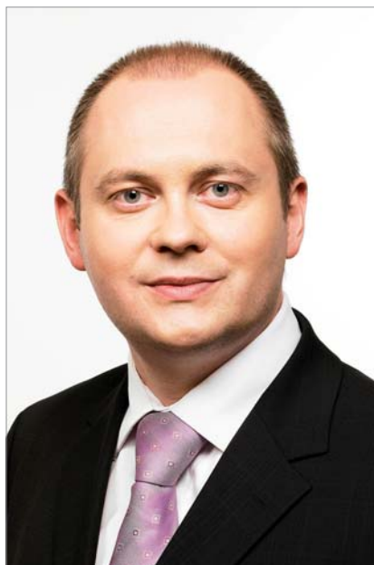
Michal Hašek hejtman Jihomoravského kraje

Přeji všem účastníkům Svatomartinské konference k 20 letům českého soutěžního práva řadu nových a hodnotných informací k tématu hospodářské soutěže a příjemně strávené tři dny v nejkrásnějším kraji České republiky, na jižní Moravě.