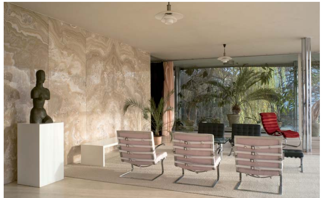
Vila Tugendhat - interiér / Villa Tugendhat - interior ( David Židlický )