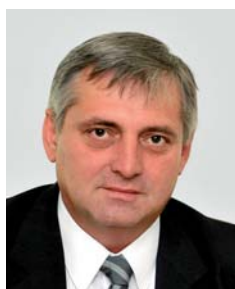
Petr Rafaj předseda Úřadu pro ochranu hospodářské soutěže

Absolvent Hornicko-geologické fakulty na Vysoké škole báňské v Ostravě. Po několikaletém působení v soukromém sektoru se stal místostarostou Frýdku-Místku a později byl zvolen do Poslanecké sněmovny Parlamentu České republiky, kde působil v rozpočtovém výboru a byl rovněž předkladatelem zákona o zneužití významné tržní síly. Od 9. července 2009 je předsedou Úřadu pro ochranu hospodářské soutěže.