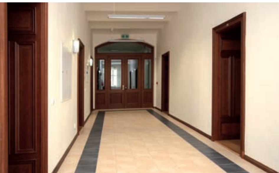
Chodba ve 2. patře