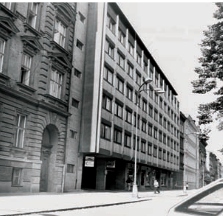
Koncem 60. let zaplnila proluku moderní budova silně narušující novorenesanční charakter třídy Kpt. Jaroše

ústavu patřily společné návštěvy divadelních představení, koncertů. Do vybavení penzionátu náležel i „čtyřlampový radioaparát“, který zprostředkoval přednáškové programy různých vysílacích stanic. Nezapomínalo se ani na sporty jako bruslení, sáňkování, lyžování nebo tenis.