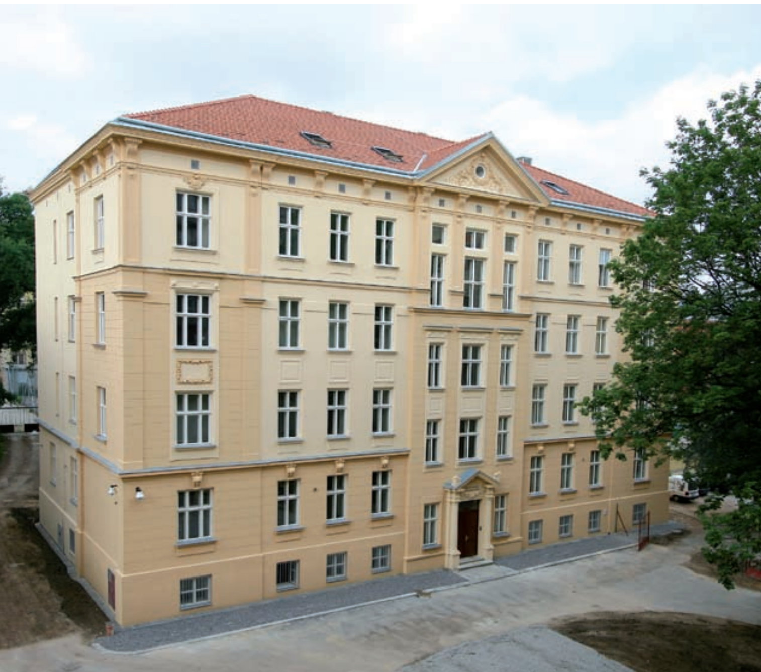
Celkový pohled na nové sídlo Úřadu