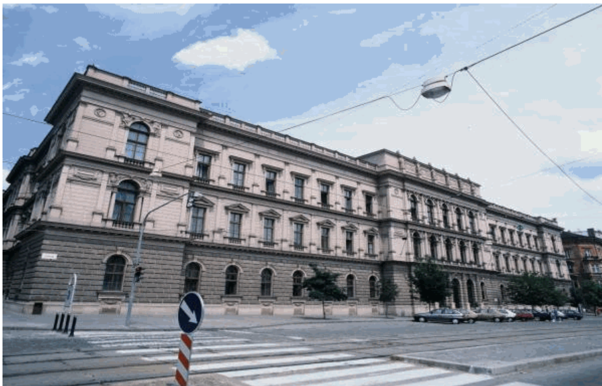
Budova se sídlem Úřadu pro ochranu hospodářské soutěže.